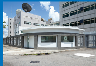
安保人员全天候监控值守

NTT香港大埔数据中心设有6层保安关卡，24/7由安保人员监控值守，加上多层认证安全门禁管理系统及全覆盖闭路电视监控系统，确保安全。我们在香港拥有逾百名专家，提供24/7迅速技术支持，并设有全套管理式服务为客户营运其ICT设备。此外，我们的团队更能为客户提供从企划、部署以至日常检测及优化等全套周期管理服务，即使客户在香港IT工作人员有限亦可安枕无忧。