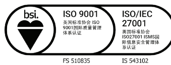
英国标准协会 ISO 9001 国际质量管理体系认证 英国标准协会 ISO 27001 ISMS国际信息安全管理体系认证