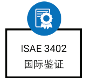
国际审计与鉴证理事会 ISAE 3402国际鉴证